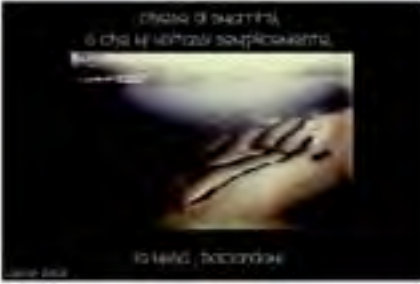
Musasirena di Luistar Manfredonia