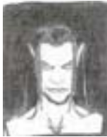
Opera di Filippo Boer Meolo Ve