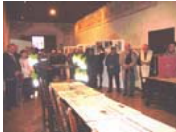
Pubblico e autorità