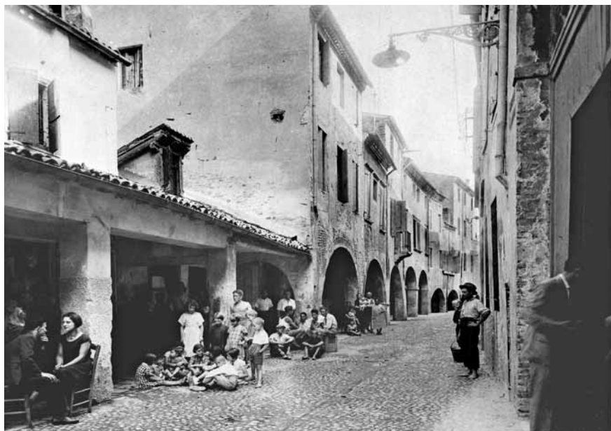
Padova, Via Conciapelli primo '900.

le prepotenze di certi industriali ed imprenditori» e a tale fine si intendeva proseguire sia con le commissioni arbitrarie obbligatorie miste sia – se ce ne fosse stata la necessità – con lo sciopero 58 . L'attività organizzativa dell'ufficio del lavoro di Padova si estende con discreta rapidità nel vasto territorio sia nella zona meridionale come Agna, Bovolenta, Candiana, Conselve, Monselice, Piove di Sacco, San Siro, Selvazzano – dove spesso l'intervento diretto dei parroci presso i vari proprietari terrieri ottenne positivi risultati contrattuali senza la necessità di vere e proprie azioni di resistenza 59 –, sia nella zona settentrionale come a Cittadella e a Galliera Veneta dove l'organizzazione promossa dal nuovo arciprete di Cittadella don Emilio Basso con l'adesione di 500 capifamiglia, fu presto messa a dura prova dall'intransigenza di alcuni proprietari terrieri della zona 60 .