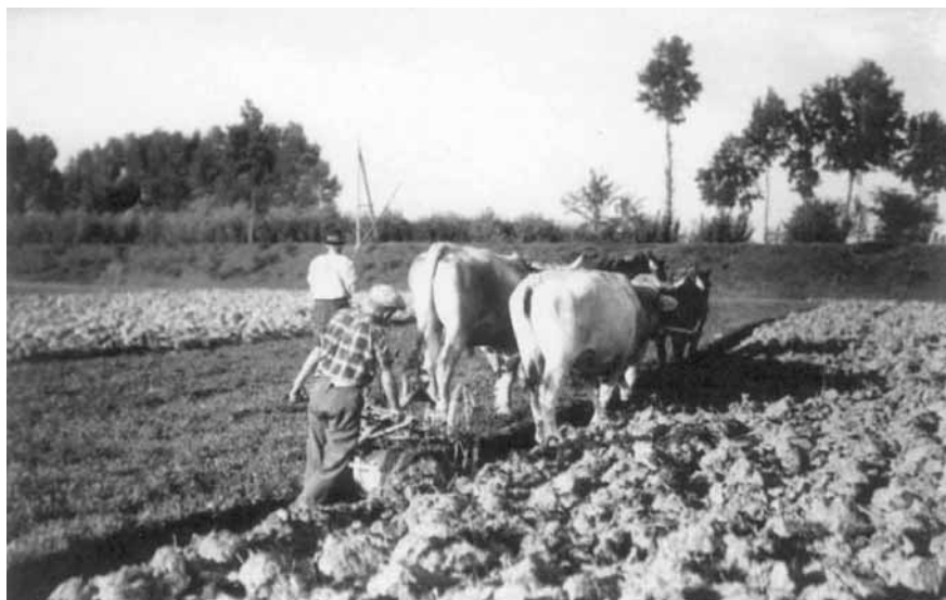
Aratura inizi '900.

resto il movimento cattolico aveva lanciato la parola d'ordine "uscire di sacrestia" per andare incontro al popolo sofferente e in vista della "riconquista cristiana della società".