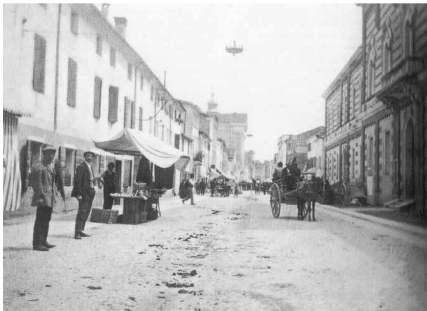
Cittadella, Via del Teatro con carretti e bancarelle nel primo Novecento.