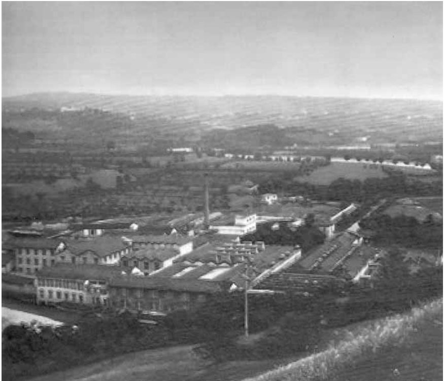
Veduta panoramica della Cartiera Nodari di Lugo Vicentino.