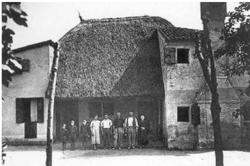
Casone veneto primo '900.

ai mezzi e alle forme dell'impegno sociale, senza che fosse implicata una diretta ingerenza da parte della Chiesa. In ogni caso va sottolineata la modernità dell'idea di democrazia di Corazzin, per il quale, sulla scia del pensiero di Toniolo, essa, per essere 'integrale', doveva estendersi alla vita economica e sociale, prima ancora che alla sfera politica.