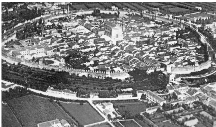
Veduta aerea del centro storico di Cittadella ( Veneto , Touring Club d'Italia, collana "Attraverso l'Italia", 1952).

Intervento all'Istituto di Istruzione Superiore "A. Meucci" di Cittadella mercoledì 20 gennaio 2010 per lo sviluppo del Modulo 3 con la partecipazione di: