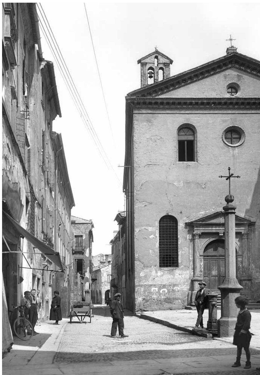
Padova - S. Rocco inizi '900.