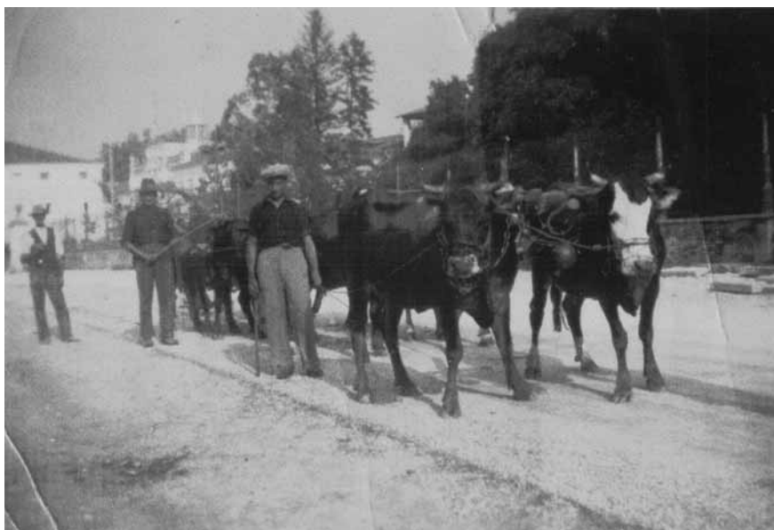
Dopo l'aratura nei dintorni di Galliera Veneta inizio '900.